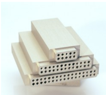
Einpresswerkzeuge für D-SUB-Steckverbinder

Wir fertigen entweder nach Kundenzeichnung oder Sie stellen uns Muster von Einpressteilen und Haltern zur Verfügung; dann übernehmen wir die Konstruktionsarbeiten.