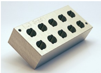
Schablone für BNC-Montage auf der Leiterplatte