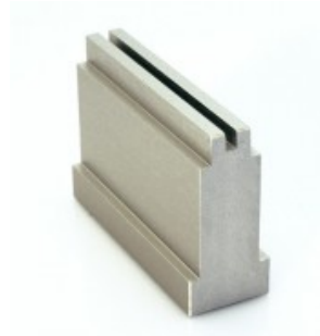
Einpresswerkzeuge für Pfostenstecker