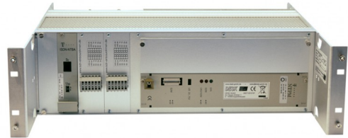
19-Zoll (482.6 mm) Baugruppenträger für 2 ISDN-Endgeräteeinschübe NTPM Baugruppenträger für 2 ISDN-Endgeräteeinschübe NTBA (NTPM-NTBA-Kombi-Baugruppenträger)

Die Datenzentrale konzentriert in einem 6HE-19-Zoll-Einbaurahmen die komplette Schnittstelle zum Carrier und kann mit verschiedenen Geräten für alle Leitungsarten bestückt werden.