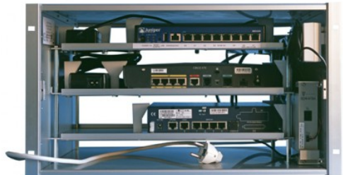
19-Zoll (482.6 mm) Systemintegration für die komplette Schnittstelle zum Carrier

19-Zoll Geräteträger fertigen wir für fast jedes beliebige Tischgerät; unsere Produkte sind ab einer gewissen Stückzahl meist günstiger als Einbausätze der Gerätehersteller.